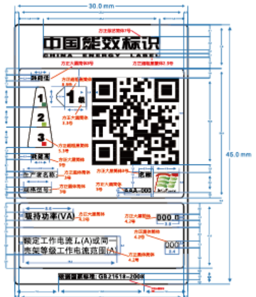
图 1 标准样式