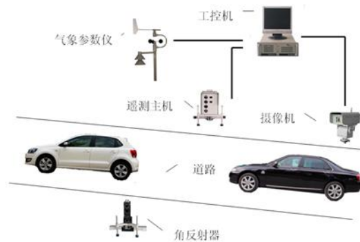
图 2 水平式汽车尾气遥测设备安装示意图