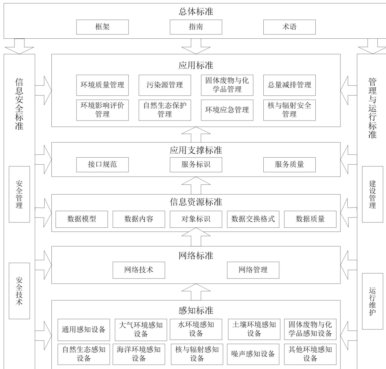
图A.1 环保物联网标准体系

环保物联网标准体系由总体标准、应用标准、应用支撑标准、信息资源标准、网络标准、感知标准、信息安全标准、管理与运行标准共八大类组成，各类标准紧密联系，对环保物联网建设与应用的各个环节起到规范指导作用。环保物联网标准体系见图 A.1。